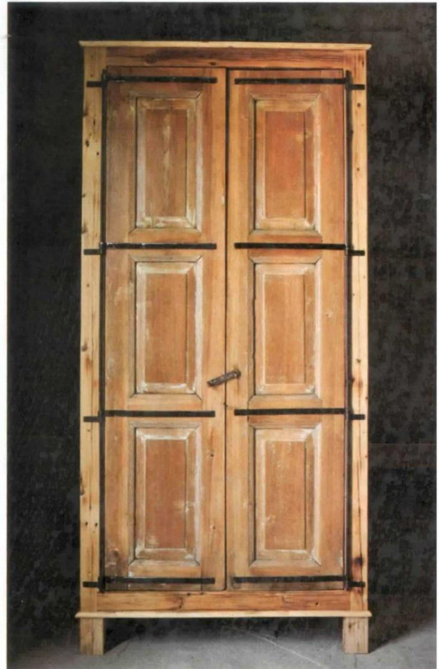
ארון טמפלרים ממוחזר. העץ עטוף בברזלים מבניין טמפלרי שיועד להריסה