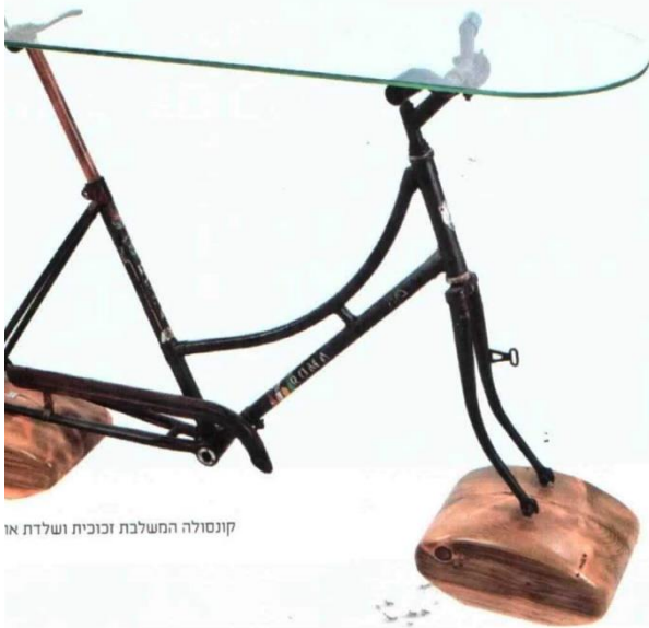
קונסולה המשלבת זכוכית ושלדת אר