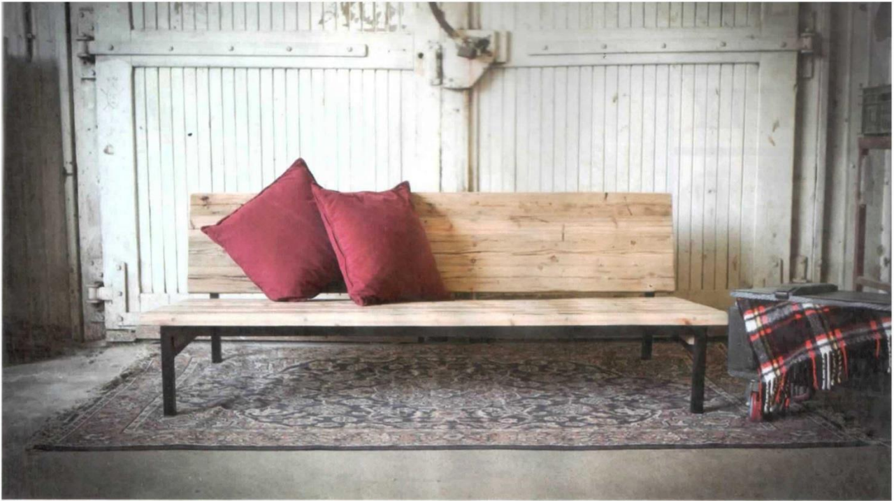
ספסל במסגרת ברזל ששימש ככורסת המתנה בקופת חולים, מחופה עץ דק ששימש רחבת ריקודים (צילומי עבודות שי דהרי: צליל אנמון)