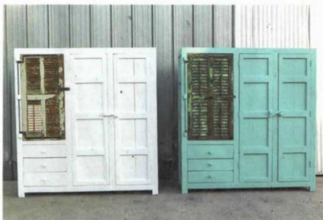
ארונות דגם נלעדי, עשויים עץ ותרסיס חלונות