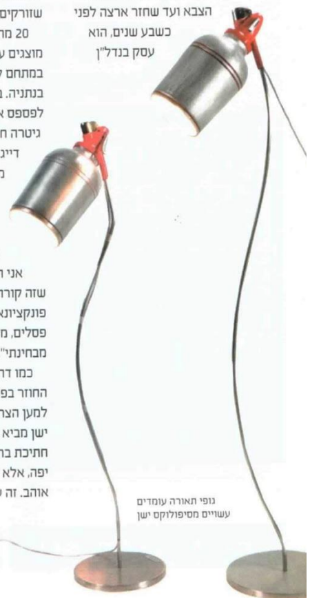
גופי תאורה עומדים עשויים מספולוקס ישן

המשותף בין דהרי לבין המעצב אייל רגב אינו רק הגישה הירוקה, אלא גם הרקע המקצועי. כמו דהרי, גם רגב עסק עד לפני מספר שנים בתחום אחר. מאז שעבר לארצות הברית לאחר הצבא ועד שחזר ארצה לפני כשבע שנים, הוא עסק בגדלין