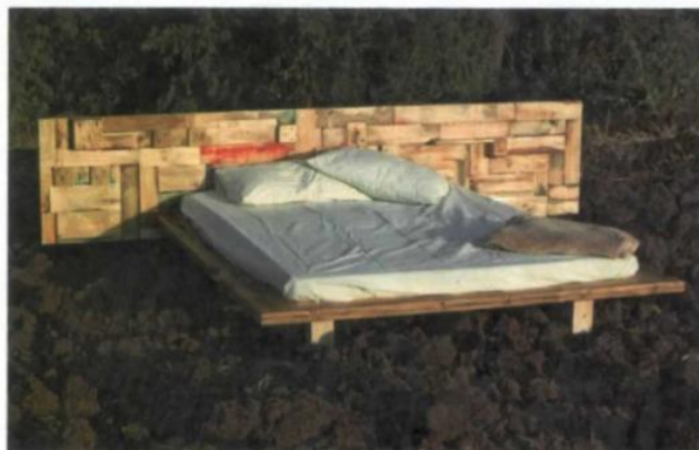
מיטה עשויה עץ ממחזור מסככה

דהרי שייך לדור חדש של מעצבים שמשלבים פילוסופיה ירוקה בעבודת העיצוב שלהם. השוני בין דהרי למרבית המעצבים הוא היעדר ההשכלה בתחום זה או בכלל. "עד לפני 3 שנים הייתי מרצה למנהיגות קהילתית-חברתית,