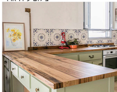
צילום דוינה זגורי

מעצבים ואדריכלים שעובדים עם הסטודיו יודעים כי חומר הגלם הוא שותף נכבד בתהליך העיצוב ויש לו מה להגיד. ועוד מעניין לדעת כי עקב העובדה שבשייקל יוצרים עם עץ בשימוש חוזר, יש הנהגים לחשוב שהעיצוב היוצא מאכן הוא כפרי, בעוד שלמעשה, הסגנון המובהק הוא תעשייתי עם נגיעות כפריות ואף מודרניות. הרהיטים והמטבחים בסגנון זה מקבלים התייחסות של Costume Made, כאשר בשייקל נותנים כבוד לחזית המטבח ומתייחסים אליה כאל תמונה כוללת. המטבח מציג חזית עצומה, שלרוב פונה לעבר החלל הציבורי. "בעינינו, המטבח הוא פלטפורמה אדירה ליצירה אינסופית עם המון חומרים שונים ומגוונים. מטבח הוא לב הבית, פולחן המשפחה. ואכן לא מפליא שהלקוחות שלנו מחפשים מטבח